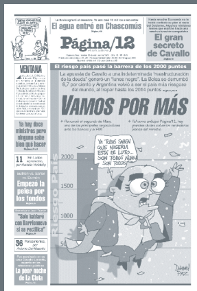
Tapa Publicación Página/12 del 30/10/2001

Por primera vez, los docentes de una universidad privada del país se agremiaron. Los profesores de la Universidad de Palermo (UP) eligieron a una conducción sindical, que funcionará como delegada del Sindicato Argentino de Docentes Particulares (Sadop).